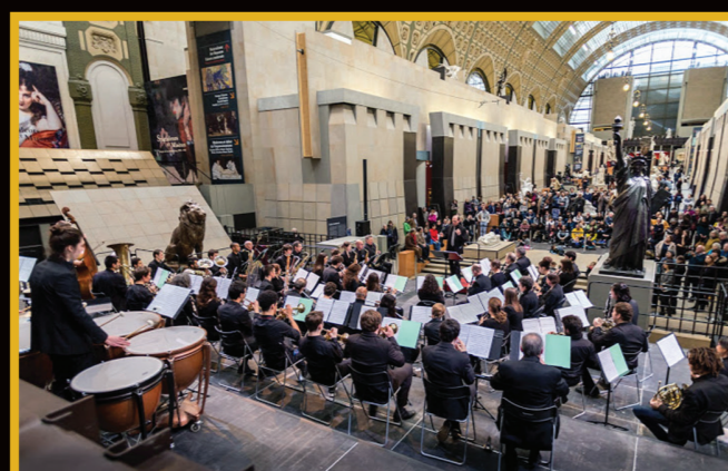
Musée d'Orsay Janvier 2016