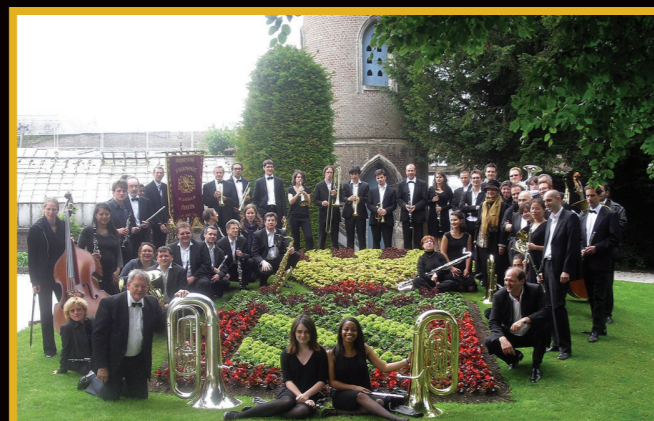
Concours Abbeville Mai 2010