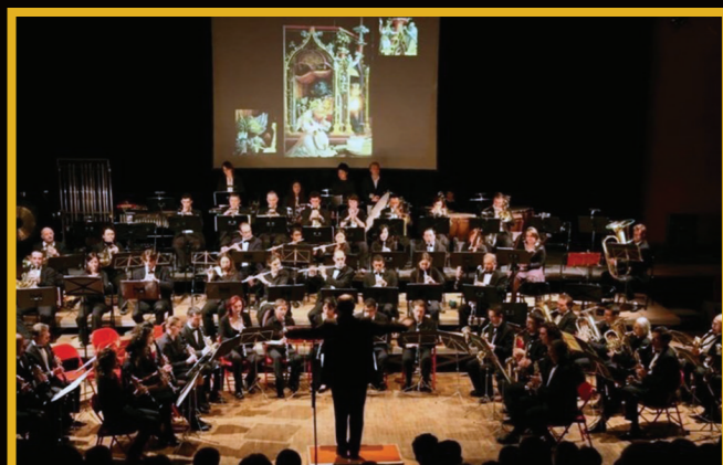
Colmar Février 2009