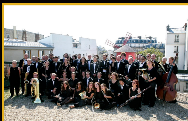
Chez Boris Vian Septembre 2010